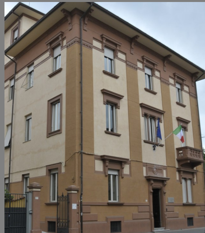
Sede U.O. Alta Formazione

Nell'ambito degli obiettivi e della strategia della Scuola Sant'Anna, la U.O. Alta Formazione, afferente all'Area della Formazione post laurea, è stata istituita quale struttura di supporto per operare nel campo dell'alta formazione e della formazione continua attraverso percorsi formativi di eccellenza rivolti a laureati e laureate, professionisti e professioniste in settori di particolare rilevanza strategica per il mondo produttivo e industriale e in linea con le nuove esigenze della società e del mercato del lavoro.